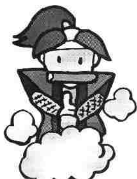
伊賀流忍者はくぶつかんの忍者