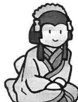
斎宮歴史博物館の十二単