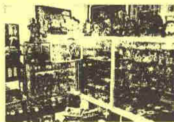
街角ブリキのおもちゃ博物館 TINs Café(ティンズ カフェ) ブリキのおもちゃコレクションの展示