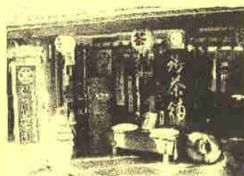
おじさんの古いもの博物館 むらい萬香園 食玩コレクションの展示