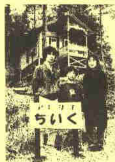
手づくりの木のおもちゃの展示