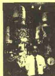
世界のかえる博物館 カエルコレクションの展示