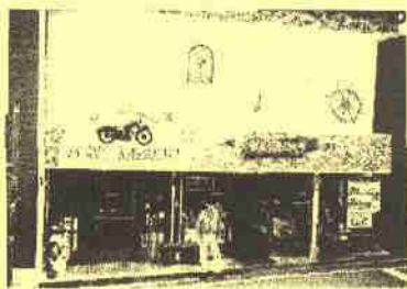
雑貨コレクション ポルトカワバタ 懐かしのPEZなどの展示